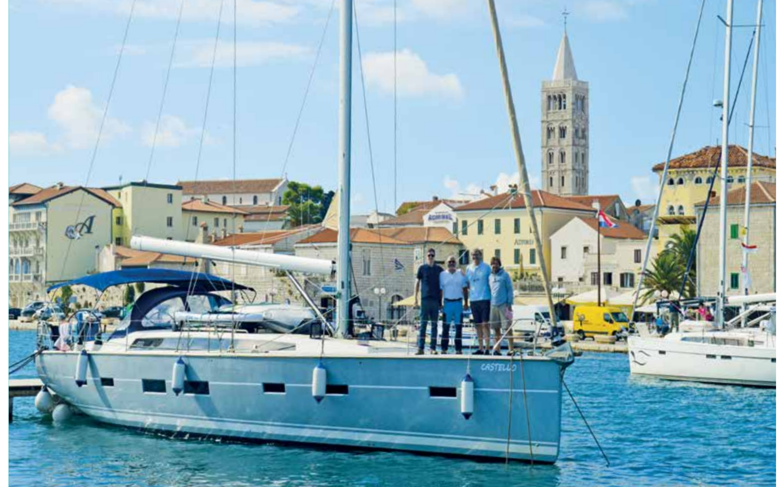
Ist die Führungsstruktur klar und sind die einzelnen Aufgaben mit Bedacht verteilt, so gelingt jedes Unterfangen auch auf engem Raum.

Der zweite Tag dient der Segel-einschulung. Gefahren wird soviel als möglich unter Segel, auch wenn das bedeutet, dass ein Tagesziel einmal neu definiert oder ein paar Stunden gegen den Wind aufgekreuzt werden muss.